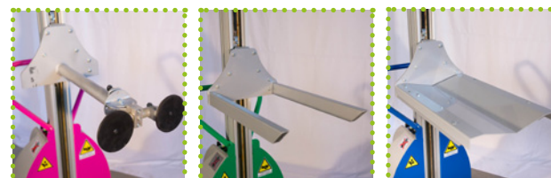
PV - Brillenträger