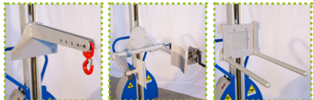
G - Haken