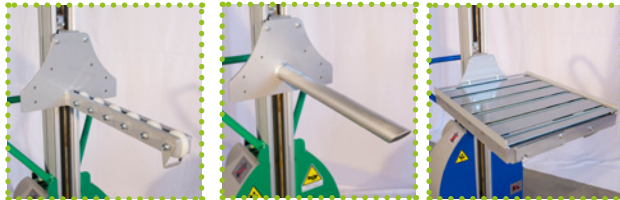
SR - Strebe mit Rollen