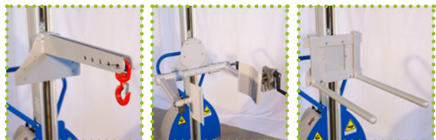
G - Crochet