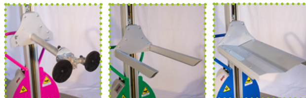
PV - Porte vitres