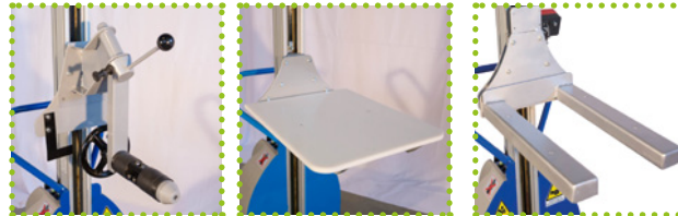
R - Roto-bobines