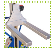
WS - Waagen-Gabel