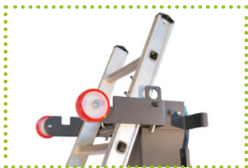
Detail vorderen Haken und Leiter Rollen auf dem Boden der Lieferwagen schiebe