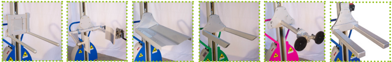
DS - Double éperon