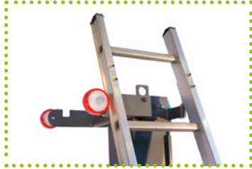
Accrochage latéral escalier

Mini élévateur à traction manuelle et levage électrique, idéal pour l'installation de climatiseurs, de lignes électriques, d'aérothermes, etc. Capacité portante 120 kg avec élévation à 2 900 mm Grâce au système de levage doté d'un actionneur à vis sans fin, Clever peut être placé à l'horizontale et il peut être chargé facilement sur le plateau d'un véhicule. Il est fourni avec une échelle en aluminium, dotée de crochets pour être fixée à l'élévateur en toute sécurité. Il est doté de quatre batteries plomb-acide 12V/18Ah sans entretien et d'un chargeur de batterie 24V/6A à bord. Pour obtenir de plus amples informations, visitez le site dédié www.levanteminilifter.com . Production italienne.