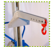
G - Crochet